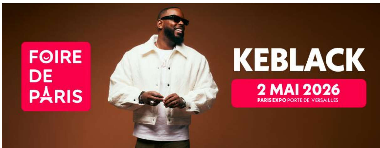
Figure incontournable de la scène urbaine française, KeBlack incarne aujourd'hui le son, l'énergie et l'émotion de toute une génération. Plus d'un milliard de vues sur YouTube, des titres devenus cultes certifiés diamant ( Laisse-moi , Bazardée , Boucan ) et un dernier album Focus , certifié disque d'or, porté par des collaborations prestigieuses avec SDM, Naza, Fally Ipupa, ...

Le samedi 2 mai 2026, la Foire de Paris entre dans une nouvelle dimension et frappe fort avec un concert exceptionnel : KeBlack en live.