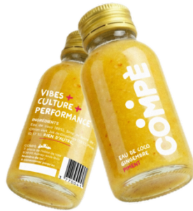
GASTRONOMIE - COMPÈ : Un booster d'énergie organique à base d'eau de coco et de gingembre comme alternative aux boissons énergisante.