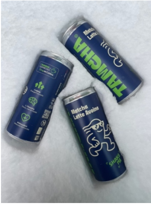
GASTRONOMIE - TAMCHA : Un matcha latte à l'avoine en canette bio et végan.