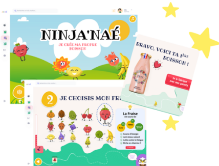
GASTRONOMIE - ANAÉ : Une boisson végétale, fruitée et fleurie, conçue pour soutenir naturellement la production de collagène.