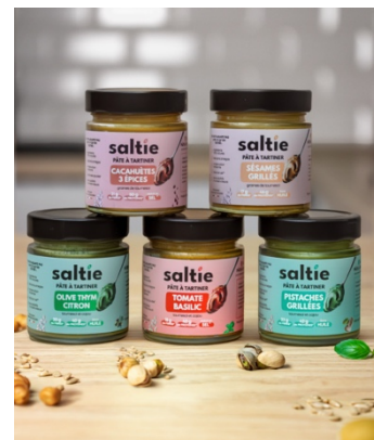
GASTRONOMIE - SALTIE & CO : Des pâtes à tartiner salées à base d'ingrédients naturels pour le brunch, l'apéro.