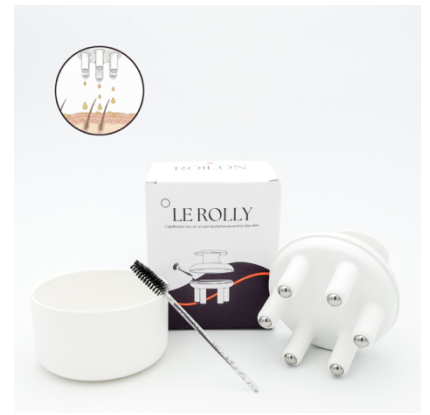
BEAUTÉ – ROILON : Des accessoires de soin innovants pour le cuir chevelu et le corps.

Ils ont été lauréats Start-Up Boost les années précédentes : Yacon & Co, Floatee, Atmos Gear, Perdieme ou encore Lizia .