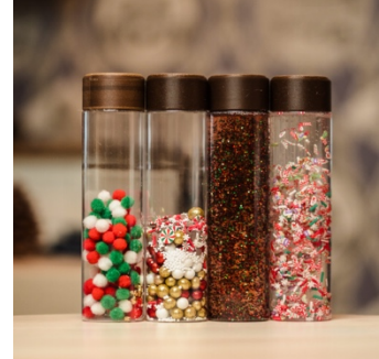
LIFESTYLE - MA PETITE MALLE D'ÉVEIL : Des bouteilles sensorielles inclusives et éco-conçues en France.