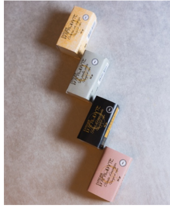
BEAUTÉ – L'ATELIER D'AFRO-DYTE : Une gamme de « soins crème » lavants artisanaux, fabriqués à Paris.