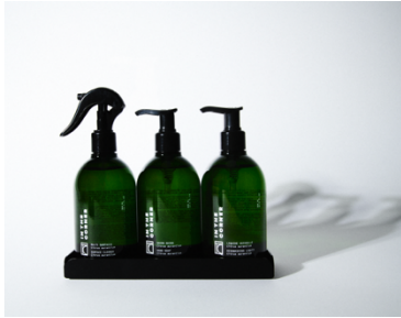
LIFESTYLE - IN THE CORNER : Des produits ménagers premium qui réinvente le geste du nettoyage en véritable expérience sensorielle.