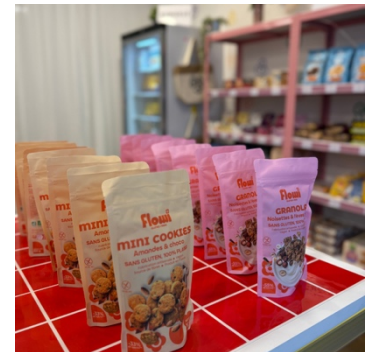
GASTRONOMIE - FLOWI : Des produits sans gluten 100% clean et 100% cool.