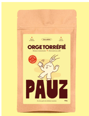
GASTRONOMIE - PAUZ : Une boisson chaude à base d'orge torréfié, naturellement sans caféine, pensé comme une alternative au café.