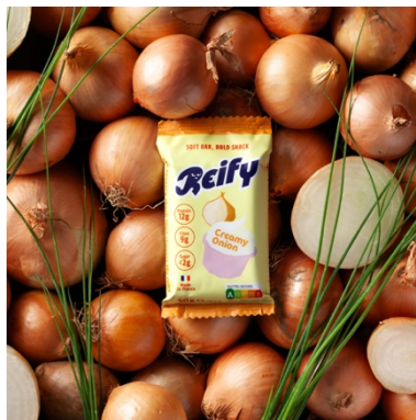
GASTRONOMIE - REIFY : Un snack salé fonctionnel, riche en protéines et en fibres, faible en sucre et sans conservateurs.