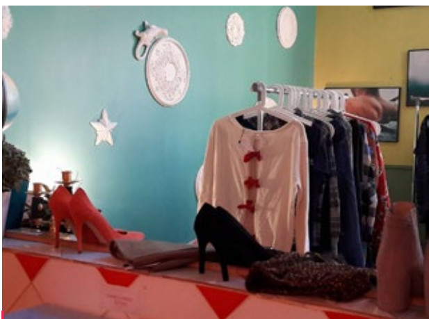
LES ARMOIRES DE PARIS