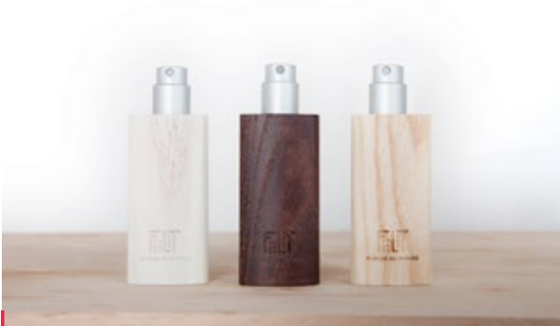
FIILIT PARFUM DU VOYAGE