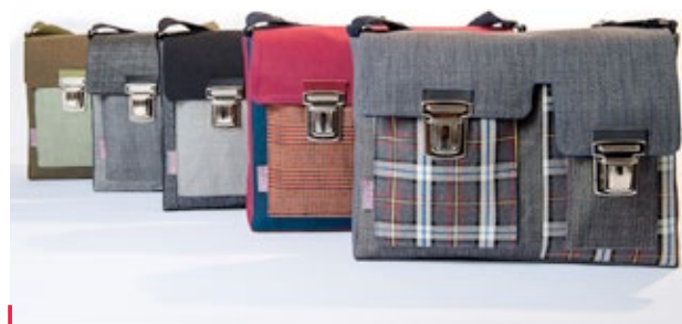
QUAND LES GARÇONS S'EN MÈLENT

Maroquinerie made in France pour hommes et femmes Marque de maroquinerie 100% made in France depuis 1984, Cuir & Terre souhaite valoriser le savoir-faire français et faire perdurer un produit durable, un circuit court et un développement local. Sacs à main, cartables, sacs à dos, fauteuils... la large gamme de modèles et de couleurs disponibles séduira les visiteurs. Et parce qu'acheter français est aujourd'hui un acte économique, social et environnemental, chaque article est délivré avec son certificat d'authenticité.