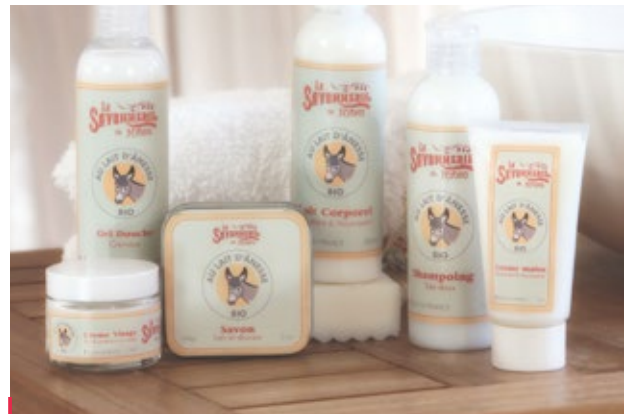
SAVONNERIE DE NYONS