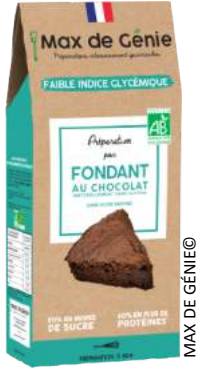
MAX DE GÉNIE©