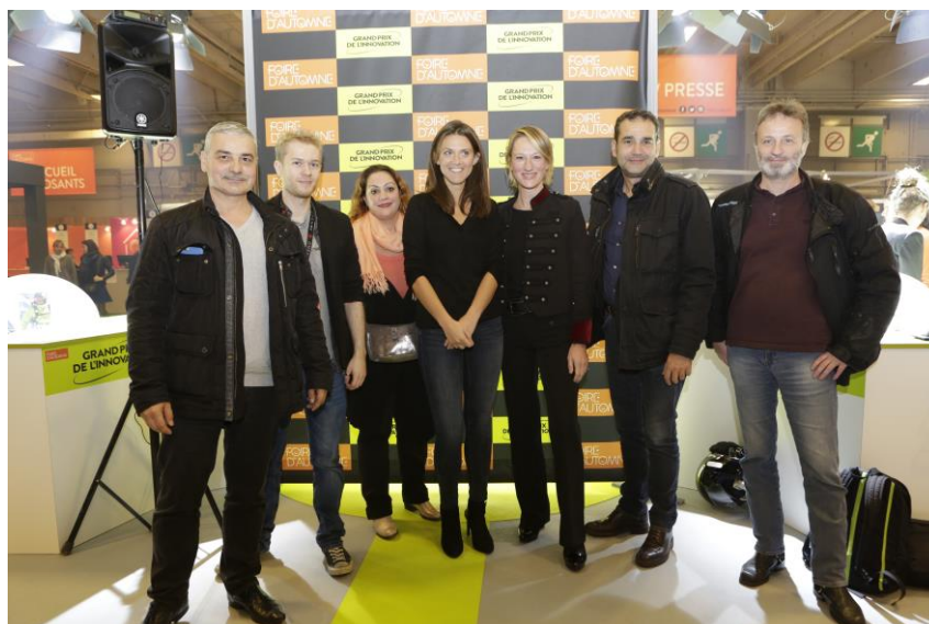
(© Marine FORABOSCO)

Tous les lauréats et les sélectionnés sont à découvrir jusqu'au 30 octobre 2016 sur Foire d'Automne Pavillon 7.2 – Stand T088