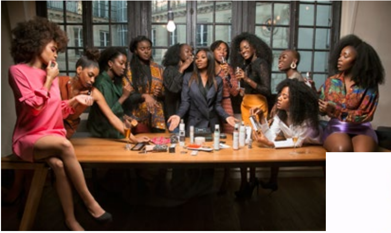
CARRÉ BLACK BOX